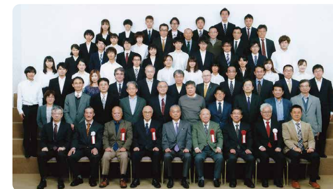
「令和元年度11月23日開催 講演会・懇親会」集合写真

なお、「講演会・懇親会」は、来年度も引き続き実施予定でありますので、会員の皆さんに楽しんでいただく企画を盛り込んでご案内をさせていただきます。