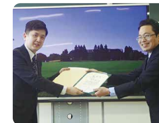
優秀学生への同窓会長表彰伝達式

令和元年度同窓会主催の「卒業生歓送会」は、3月24日(火)に予定していましたが、新型コロナウイルス感染症拡大防止のため中止し、学科毎に行われた卒業証書、修了証授与式時に優秀学生13名に対して「同窓会長表彰」と「同窓会のしおり」(会員名簿)配布を行いました。