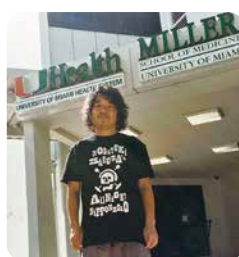
ラジオ番組のTシャツです

年齢四十を過ぎて、マイアミ大学へ研究留学の機会を得ました。アメリカ南部の生活様式を体験し、キーウエスト、ケネディ宇宙センター、ディズニーワールドなどフロリダライフを満喫のはずが、コロナの脅威を感じる毎日です。8割おじさんの言い付けを忠実に守りつつ、強い陽射しを目いっぱい浴びて、イグアナやクジャクを横目に公園を散歩し、ドリームエンタメラジオを聴いては、気は心からの精神で日々過ごしております。