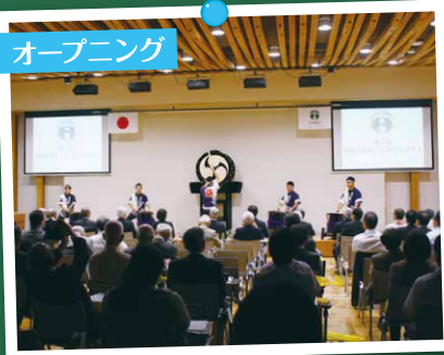
迫力のすずかけ太鼓で開幕