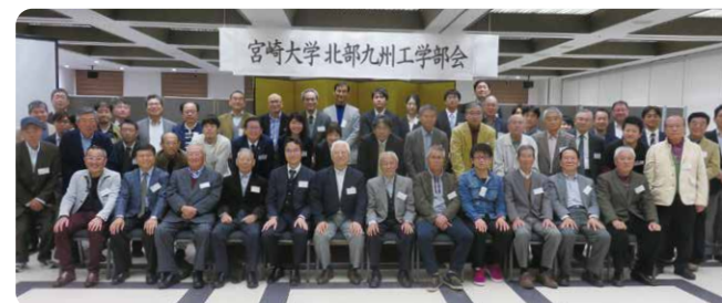
北部九州工学部会(福岡市)

http://www.web-dousoukai.com/miyazaki-com/miyazaki-eng/