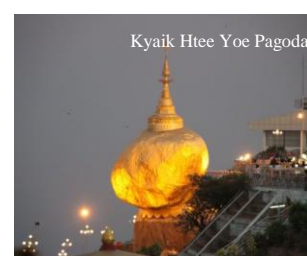
Kyaik Htee Yoe Pagoda