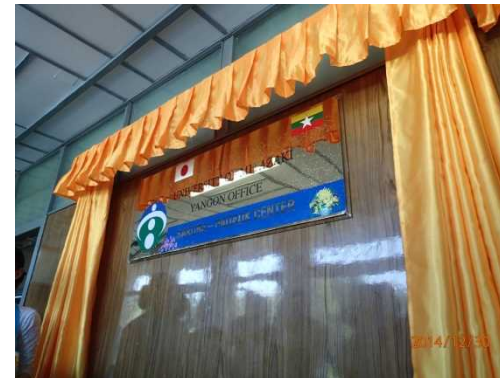
オフィスプレート