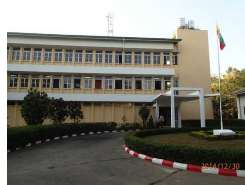
オフィスビル外観